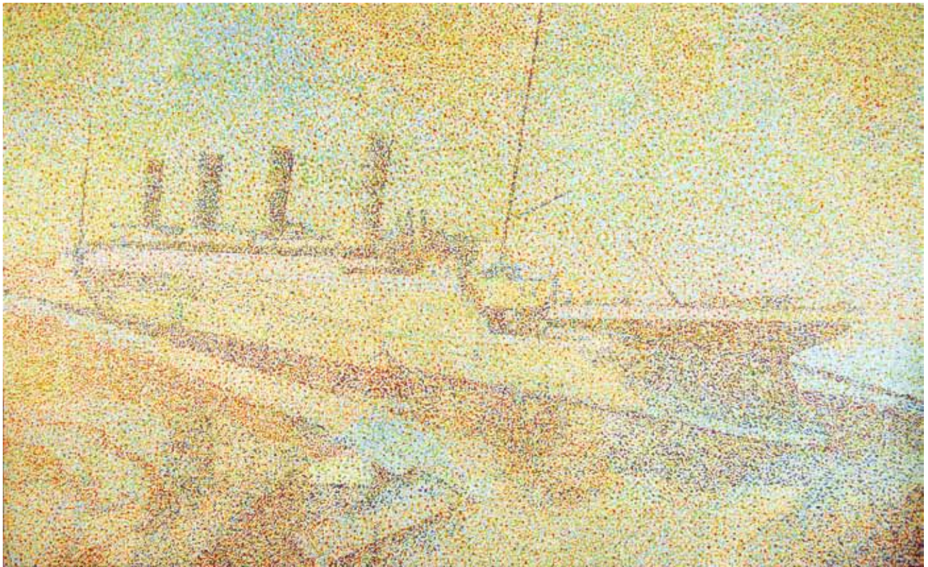
Titanic , 2012 (3,1 X 1,9 m) peinture acrylique sur canevas